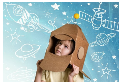
▲ O czym marzą dzieci? Zapytaliśmy o to 1313 uczniów szkół podstawowych

Marzenia to klucz do dziecięcej duszy. Dlatego postanowiliśmy bliżej się im przyjrzeć. W kwietniu 2019 roku przeprowadziliśmy wśród 1313 uczniów szkół podstawowych Polski ankietę „O czym marzą współczesne dzieci”. Wzięli w niej udział uczestnicy trzeciej edycji konkursu literackiego dla uczniów szkół podstawowych „Popisz się talentem”. Wyniki są fascynujące!