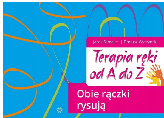
TERAPIA RĘKI OD A DO Z. OBIE RĄCZKI RYSUJĄ/ JACEK SZMALEC, DARIUSZ WYSZYŃSKI, WYDAWNICTWO HARMONIA, 2020,