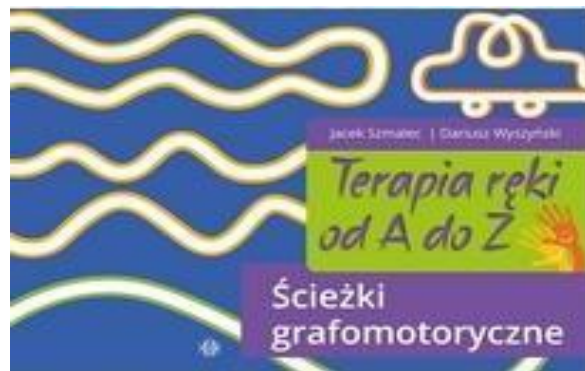
TERAPIA RĘKI OD A DO Z. ŚCIEŻKI GRAFOMOTORYCZNE / JACEK SZMALEC, DARIUSZ WYSZYŃSKI, HARMONIA, 2019

Program Terapia ręki od A do Z ma na celu ograniczenie problemów dzieci z pisaniem ręcznym oraz przygotowanie maluchów do nabycia tej umiejętności. Przeznaczony jest dla rodziców i pedagogów, wychowawców pracujących z dziećmi w wieku przedszkolnym, u których występują trudności grafomotoryczne. Może również posłużyć jako materiał treningowy przed rozpoczęciem nauki pisania. Obie rączki rysują to piąta część zestawu Terapia ręki Składa się z 28 kart z ćwiczeniami. Ich celem jest kształtowanie symetryczności pracy obu rąk. Ponadto podczas wykonywania zadań dziecko doskonali prawidłową postawę ciała, usprawnia rozwój obręczy barkowej oraz rotację w przedramieniu, co pozytywnie wpłynie na tempo i jakość pisania. Dziecko w trakcie zabawy ćwiczy ruchy wykonywane podczas pisania, w tym wyizolowane ruchy palców. Zadaniem dziecka jest poprzez symetryczne użycie obu dłoni narysowanie takich samych elementów jak na karcie. Kartę z ćwiczeniem można powiesić na tablicy, aby na początku dziecko w pozycji stojącej mogło paluszkami wodzić po śladzie.