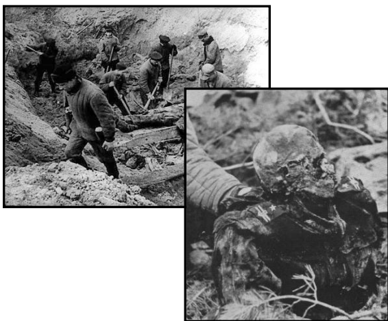
Katyn - ekshumacja zwłok

Wkrótce po zajęciu ziem polskich Rosjanie rozpoczęli planową akcję niszczenia inteligencji. Wielu Polaków aresztowano lub na miejscu rozstrzelano. Inni trafiali na Syberię. Szeregowych żołnierzy wziętych do niewoli w większości zwolniono, lecz nie mieli tego szczęścia oficerowie. Zostali oni zamknięci w trzech obozach: Kozielsk, Starobielsk i Ostaszków, a następnie na rozkaz Stalina brutalnie zamordowani. Z 15 tysięcy oficerów ocalało tylko 500. Ich groby znajdują się w Katyniu, Piatichotkach i Miednoje. Rząd radziecki przyznał się do zbrodni dopiero w 1989 roku.