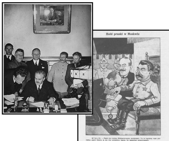
Ribbentrop i Mołotow podczas podpisywania paktu; obok - karykatura w jednej z polskich gazet

23 sierpnia 1939 r. minister spraw zagranicznych III Rzeszy Joachim von Ribbentrop i komisarz spraw zagranicznych ZSRR Wiaczesław Mołotow podpisali pakt o nieagresji, do którego dołączony był tajny protokół. W protokole była mowa o podziale Polski i republik bałtyckich na strefy wpływów ZSRR i Niemiec.