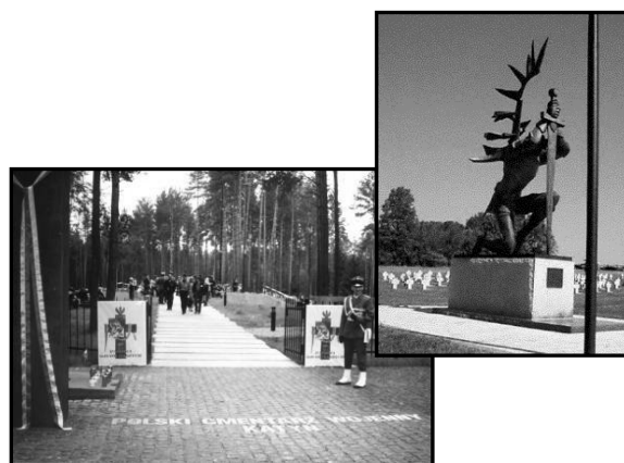
Katyn - cmentarz