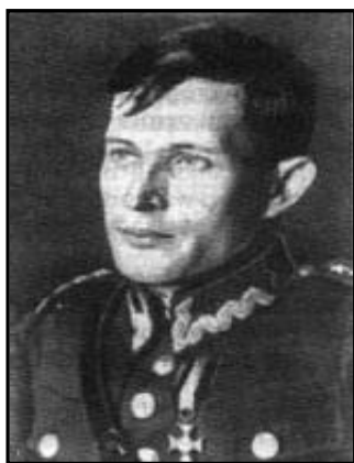
gen. Władysław Langner

Mimo rozkazu dowództwa doszło do walk z bolszewikami. Pod Kodziowcami 101 Pułk Ułanów pod dowództwem gen. Wacława Przeździeckiego rozbił część radzieckiego korpusu pancernego. Zwycięskie walki pod Szackiem i Wytycznem toczyły oddziały KOP.