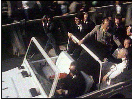
Zamach Ali Agcy w 1981 roku

Nawet zamach 13 maja 1981 roku nie przerwał jego podróży.