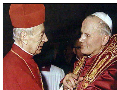
Spotkanie z prymasem Wyszyńskim